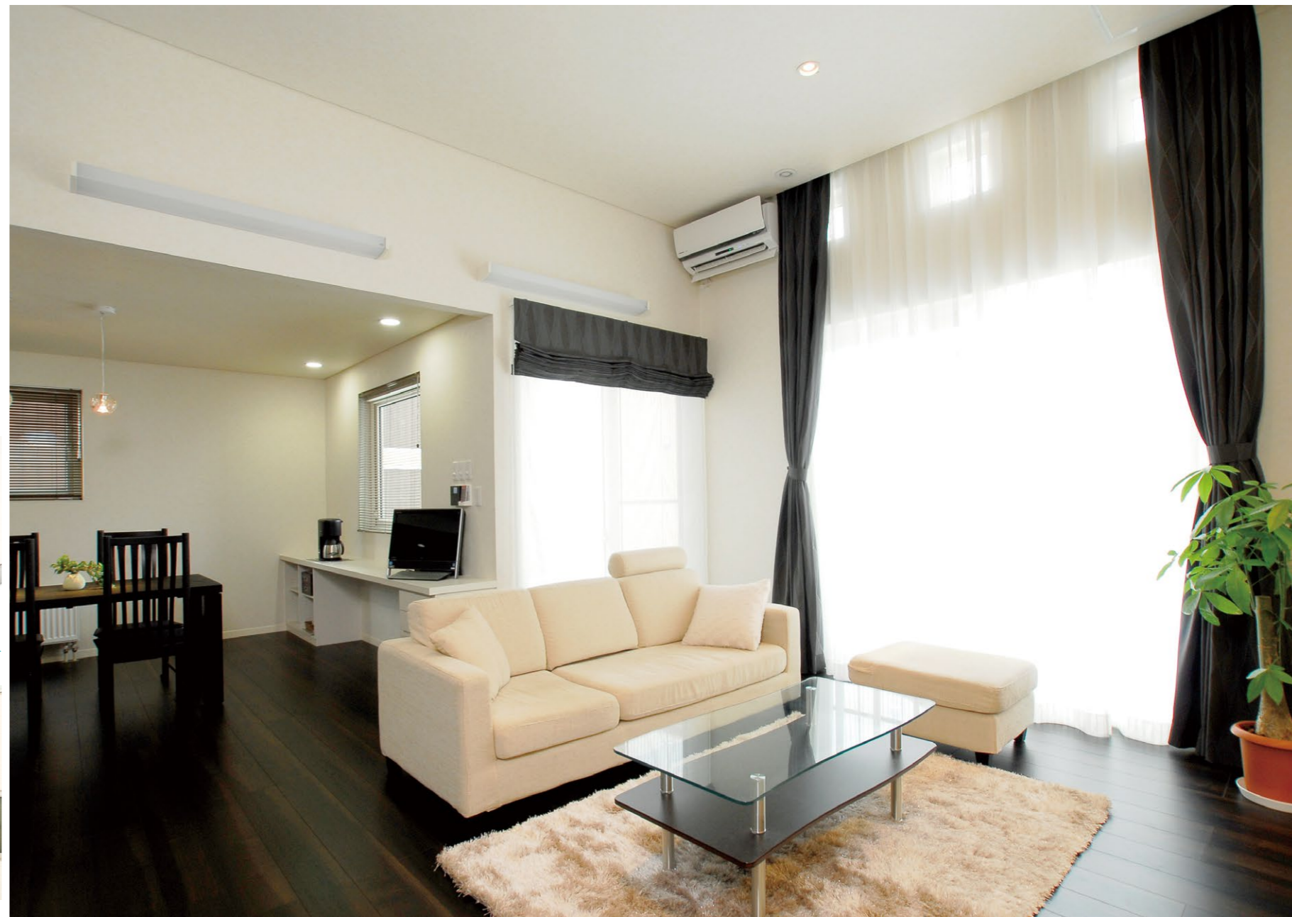
ゆったりとした広さのLDKは、大きな窓の近くにあったかエアコンを設置しているので放熱パネルの数も少なくすっきりとした空間に