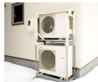
2台のヒートポンプユニットは上がエコキュート、下がヒートポンプ温水暖房システム

「晴れた日にはゲストルームの窓から雌阿寒岳が見えるのですが、その景色を見るたびにいつまでもこの景色を見ていたいな、と思うんです。そのためにはやはり環境に負荷をかけない暮らしが大切。スマート電化の設備を選んで良かったと思います」