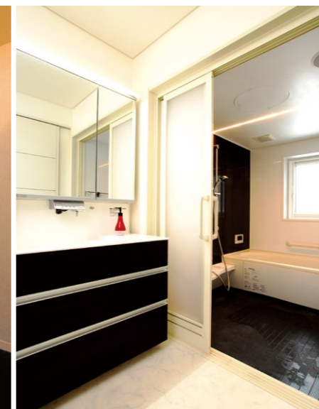
2階のバスルームでもシャワーの水圧が弱まらず快適