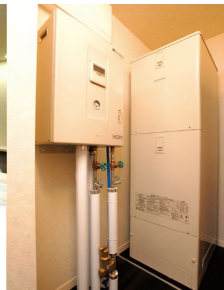
食品庫の奥に収められたエコキュートとヒートポンプ温水暖房システムの熱交換ユニット

「仕事も忙しく家事の時間は限られているので、加熱時間が短くて済むIHクッキングヒーターには本当に大助かり。料理の後の油汚れの飛び散りも少ないので、お手入れもラクなのがうれしいですね」(奥さま)