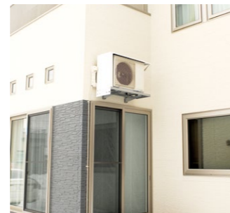
あったかエアコンのヒートポンプユニット